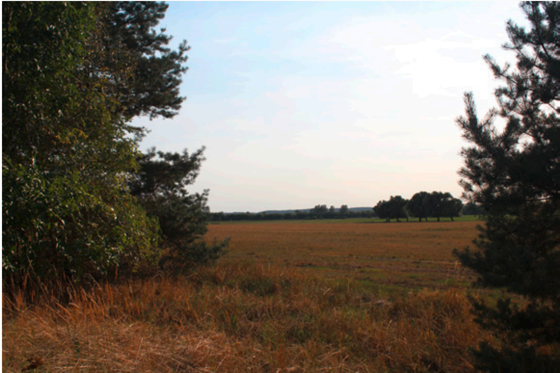
Blick beim Grundstück