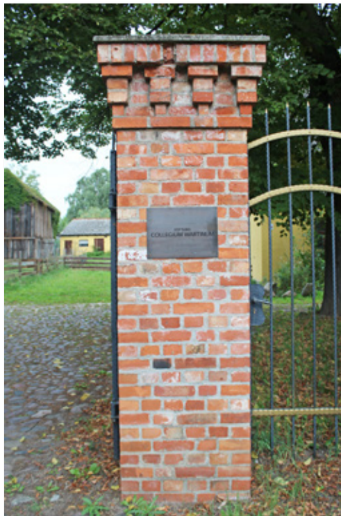
Stiftung Collegium Wartinum

Schloß mit Park und Teich. Hier arbeitet die Stiftung Collegium Wartinum am Erhalt und Wiederaufbau ( www.schloss-wartin.de ). Es soll eine stille Stätte der Wissenschaft und Kultur sein, ein Ort des Nachdenkens, der Begegnung, des Lesens und Schreibens.