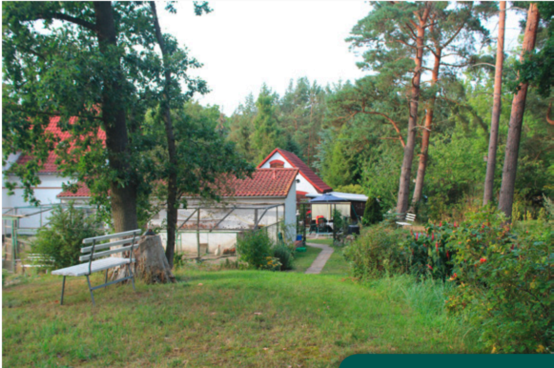
Aussichtsbank auf einer Anhöhe

Grundstück ist in mehrere Räume gegliedert, z. B. ein Vorgarten mit Sitzplatz, eine Obstwiese, ein Waldstück mit Aussichtsplatz, Nutzgarten mit Gewächshaus, Hühnerauslauf, Lagerplatz für Holz etc.