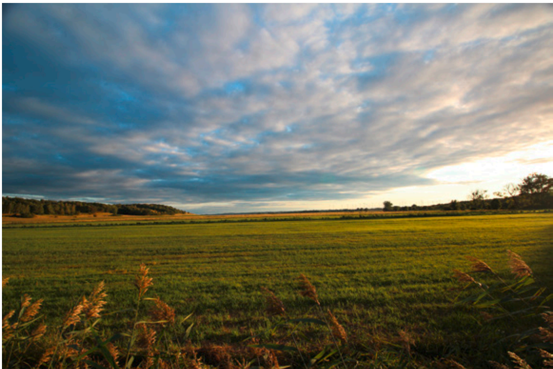
Abendstimmung im Randowtal