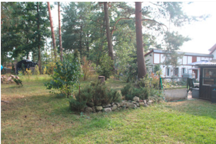
Blick zu Werkstatt und Stall