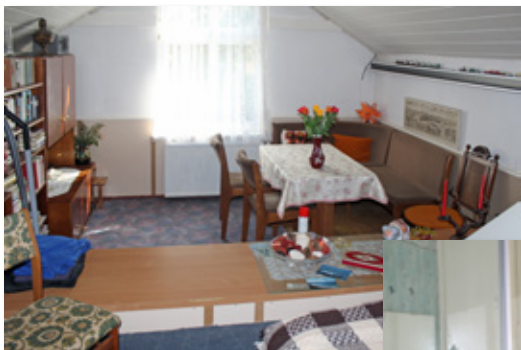
Zimmer im OG