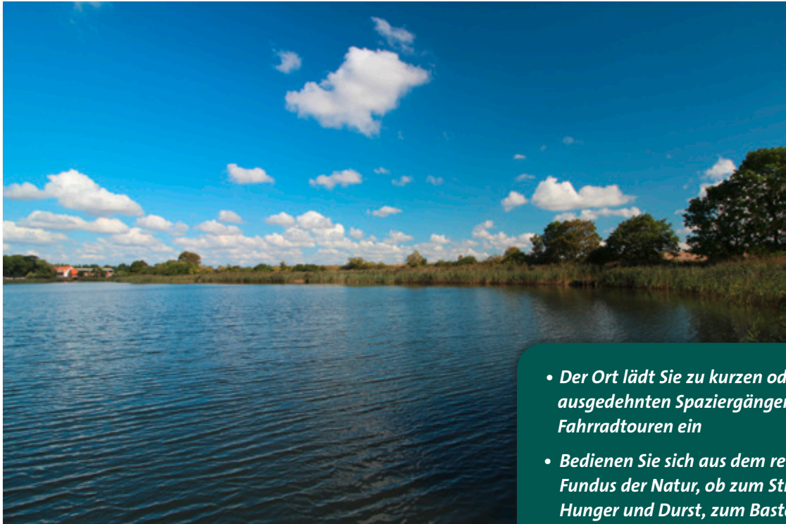
Badesee in Grünz, 5 km