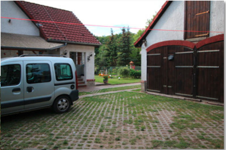
Blick zum Wohnhaus und zur Garage