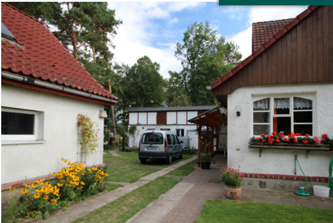
Blick zum Stall