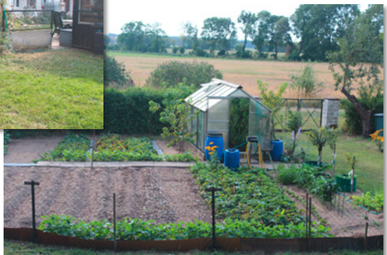
Gemüsegarten mit Blick in die offene Weite